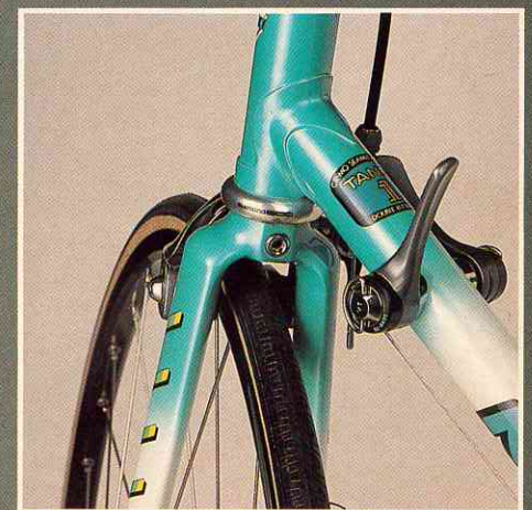
Aerodynamic Design im Detail