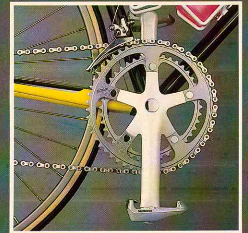
Finish und Funktion das perlweiße Bio Pace Tretlager