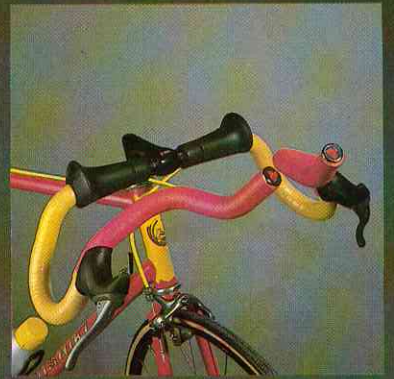
Scott-Lenker im Detail

Für modische Rad-Freaks und Triathleten eine ideale Wettkampfmachine. Besonders für die langen Distanzen mit Scott-Lenker zu empfehlen. Das „Herz“ dieser Maschine ist ein superstarker Rahmen.