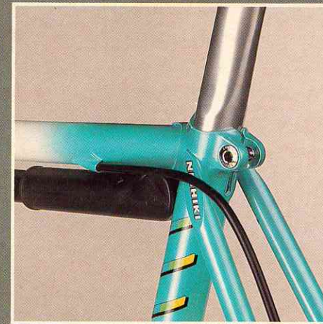
Innenverlegter Bremszug Perfektion + Finish

Wie man ein Rennrad leichter und stärker macht? Ganz einfach: Man verarbeitet Tange 1 Rohre.