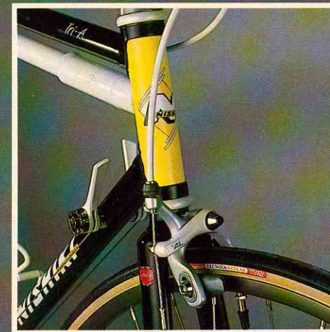
SIS Schalthebel und Hi-Tech-Bremse – sicher und wunderschön –

Eine echte Wettkampfmaschine im Aero Konzept. Durch fantasievolles Design wird die Freude an unserem wunderschönen Sport ausgedrückt – garantiert von japanischer Hi-Tech Funktion. Hier werden die hohen Erwartungen an moderne Komponenten in Funktion und Qualität erfüllt.