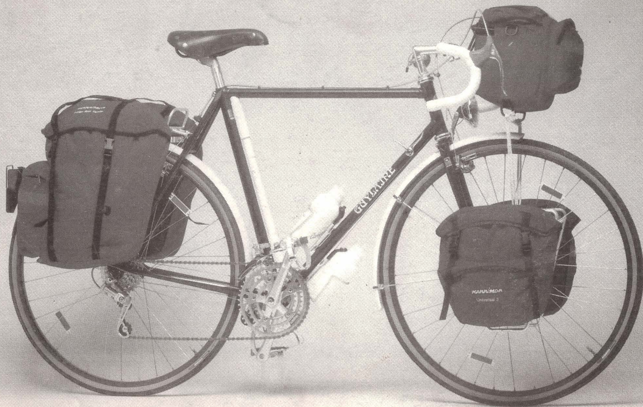
REISERAD GUYLAINE Luxus