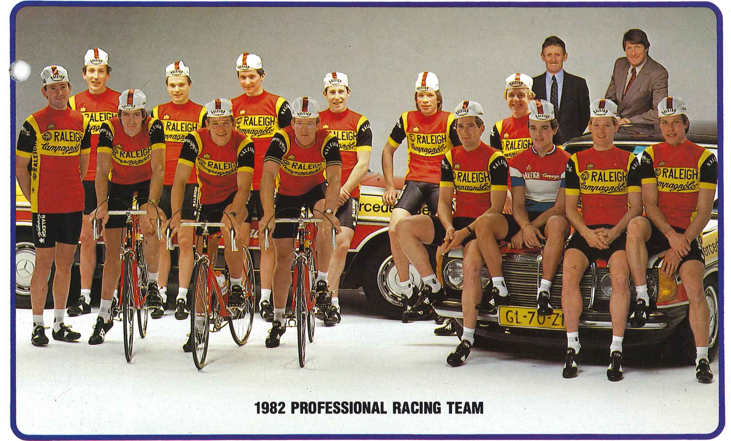
1982 PROFESSIONAL RACING TEAM