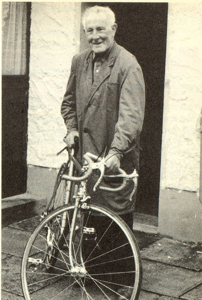
Ein neues Stahlross aus dem eigenen Stall.