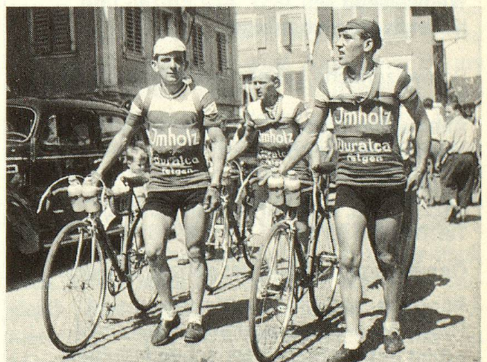
Die «Imholz-Gruppe» an der Tour de Suisse.